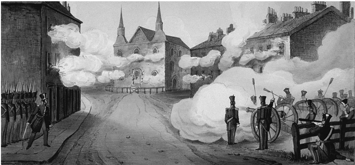
Vue de la façade de l'église Saint-Eustache occupée par les insurgés, Charles Beauclerk, 1837.

b) Pour quelle raison le gouverneur Durham est-il rappelé à Londres?